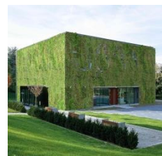
Hörsaal St. Georgen