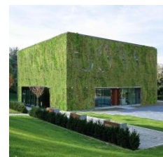
Hörsaal St. Georgen